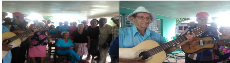
Imagen 5. Casa de abuelos municipal