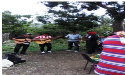
Imagen 6. Comunidad El Canal