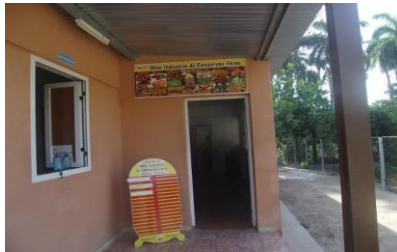
Imagen 1. Miniindustria Jesús Lores, Imías

Incremento de las producciones de 2 T mensual que se producían antes del proyecto, se llegó a 4 T en igual período.