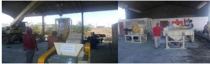
Imagen 2. Minindustria de materiales de la construcción.