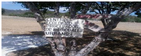
Imagen 3. Área ecológica de procesamiento de residuales sólidos

Incremento en la selección y aprovechamiento de materiales reciclables permitiendo la participación comunitaria de la separación en origen de materiales de reciclables a partir de la sensibilización y educación ambiental de conjunto al sector educacional con la participación de círculos de interés.