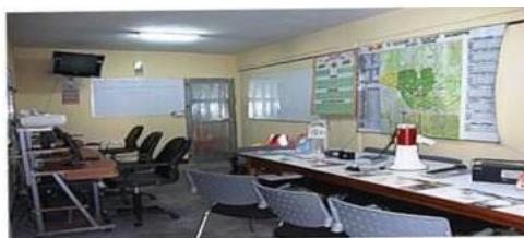
Imagen 4. Centro Municipal de Gestión de Riesgos

Objetivo general: Fortalecer los procesos de la gestión municipal para la reducción de riesgos de desastre ambiental participativo como contribución al desarrollo sostenible del municipio.